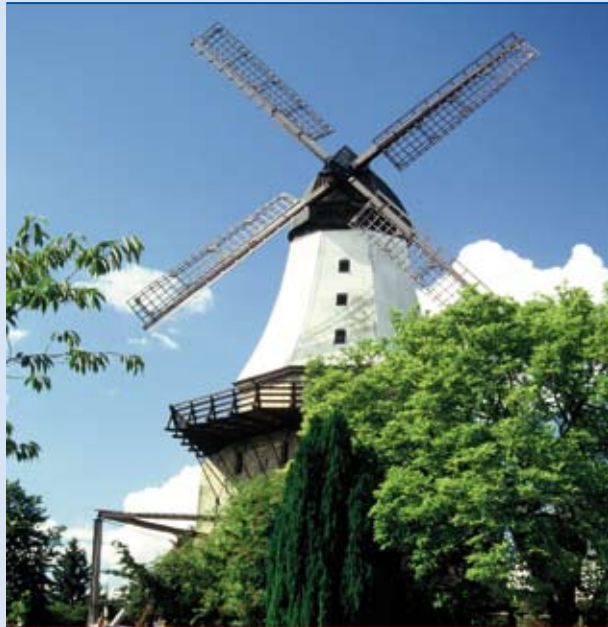
Alte Mühle von Kappeln

► Seinen ursprünglichen Ortsnamen „Cappel“ erhielt Kappeln als kleines Fischerdorf am Rande der Schlei durch den Bau einer Kapelle. Erstmals urkundlich erwähnt wurde der Name 1357 als „dat Dorp tho Cappel“. Das einzige Überbleibsel von damals ist einer von über 40 Heringszäunen, der noch heute in Gebrauch ist und an den sogenannten Kappeler Heringstagen geleert wird. Das heutige Kappeln wurde vor allem durch die Fernsehserie „Der Landarzt“ unter dem Namen „Deekelsen“ bekannt. Diverse Schauplätze aus der Serie können direkt in der Innenstadt besichtigt werden. Zudem laden zahlreiche Boutiquen, Geschäfte und Restaurants zum Bummeln und Verweilen ein. Sportlich und kulturell hat Kappeln dank seiner zahlreichen Vereine auch einiges zu bieten. Die vor der Haustür gelegene Ostsee zieht Bewohner und Urlauber gleichermaßen an. ◀