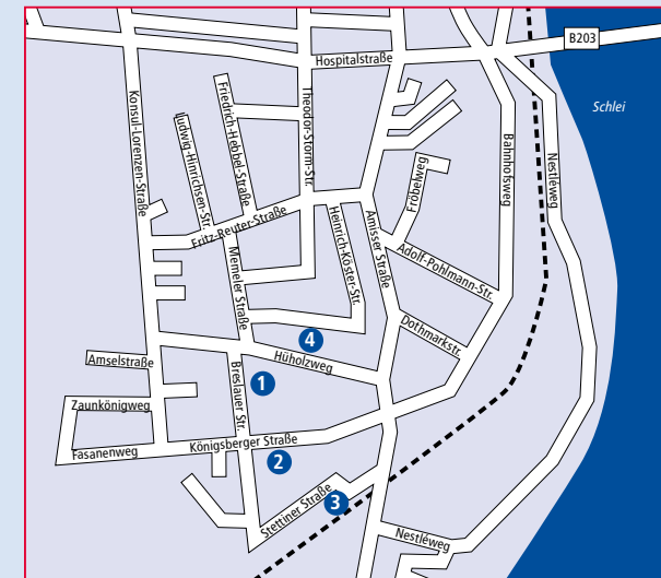
Hier finden Sie unsere Wohnobjekte

Es ist nur dem Geldmangel der Stadt Kappeln zu verdanken, dass es den Heringszaun noch gibt. Es fehlten einfach die finanziellen Möglichkeiten, um den Zaun abzureißen. Und so war der Zaun viele Jahre der Natur ausgesetzt und verwahrloste zunehmend. Der Verschönerungsverein nahm sich dann der Pflege und dem Erhalt des Zaunes an. ◀